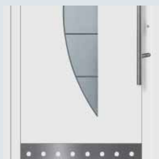
Chapa de zócalo de acero inoxidable