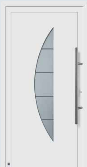
Modelo 908 A en blanco tráfico RAL 9016.