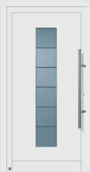
Modelo 906 A en blanco tráfico RAL 9016.