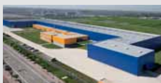
Hörmann Tianjin, China