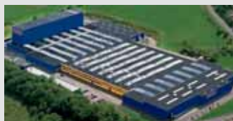
Hörmann KG Freisen, Alemania