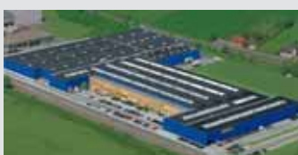
Hörmann KG Werne, Alemania