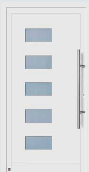
Modelo 902 A en blanco tráfico RAL 9016.