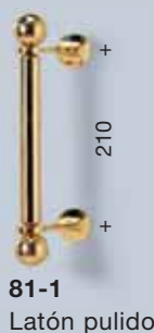
81-1 Latón pulido