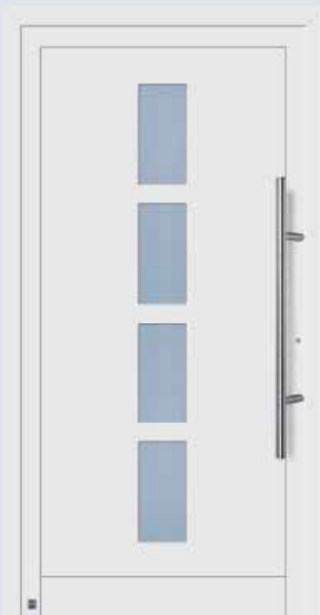
Modelo 900 A en blanco tráfico RAL 9016.