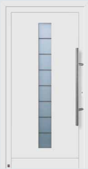
Modelo 904 A en blanco tráfico RAL 9016.