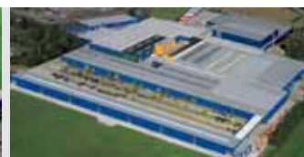
Hörmann KG Brockhagen, Alemania