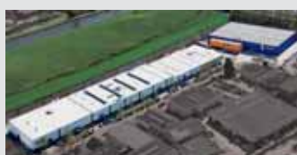
Hörmann Alkmaar B.V., Países Bajos