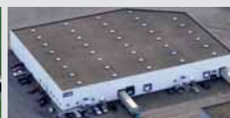
Hörmann Flexon, Leetsdale PA, EE.UU.

El Grupo Hörmann es el único fabricante en el mercado internacional que ofrece todos los elementos principales de construcción de fabricación propia.