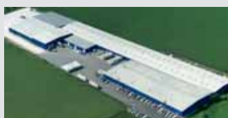
Hörmann LLC, Montgomery IL, EE.UU.