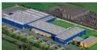
Hörmann KG Antriebstechnik, Alemania