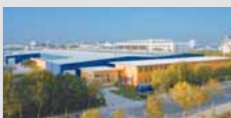
Hörmann Beijing, China