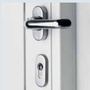
Manilla interior de acero inoxidable con roseta de bombín