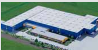
Hörmann KG Dissen, Alemania