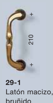
29-1 Latón macizo, bruñido