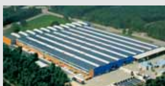
Hörmann Genk NV, Bélgica