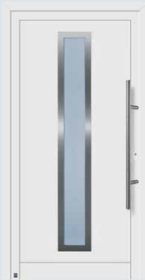
Modelo 975 A en blanco tráfico RAL 9016.