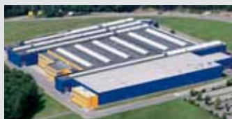
Hörmann KG Eckelhausen, Alemania