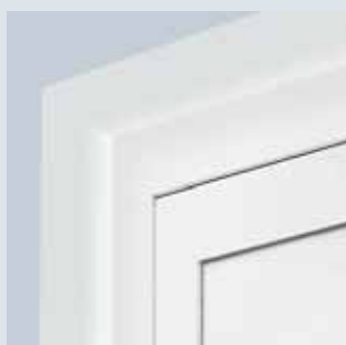
Marco embellecedor redondeado Rondo 70 en el exterior