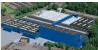
Hörmann KG Amshausen, Alemania