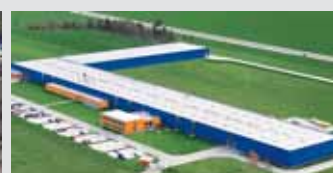
Hörmann Legnica Sp. z o.o., Polonia