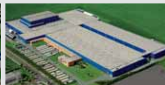
Hörmann KG Ichtershausen, Alemania