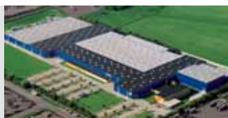
Hörmann KG Brandis, Alemania